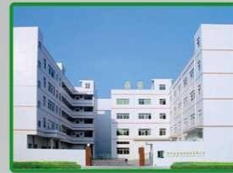
Asistente de Tiempo en Fábrica