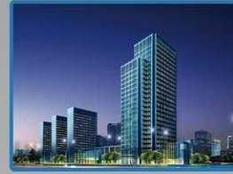
Seguridad en Red a Edificios