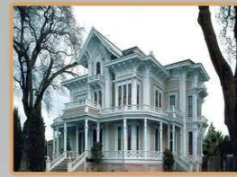
Control de Acceso Independiente en Casas