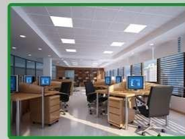
Asistencia de Tiempo en Oficina