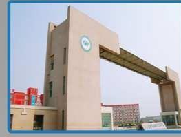
Seguridad en Red para Escuelas