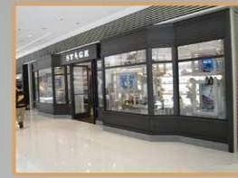
Control de Acceso Independiente en Tiendas