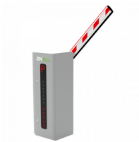
BARRERA VEHICULAR 4.5M. 2.5SEG C-LED CABINA IZQUIERDA

Codigo: 42239 Marca: ZKTECO PROBG3045L-LED $1.323.940 +iva