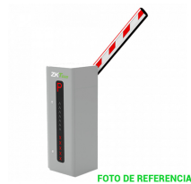
BARRERA VEHICULAR 4.5M. 2.5SEG C-LED CABINA DERECHA

Codigo: 42308 Marca: ZKTECO BL-852Q38A-LP $762.090 +iva