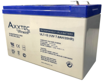
BATERIA 12V - 7.0 A ULTRACELL

Codigo: 08010 Marca: ULTRACELL UL7-12 $10.780 +iva