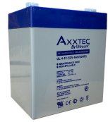
BATERIA 12V - 4.0 A ULTRACELL

Codigo: 08008 Marca: ULTRACELL UL18-12 $40.220 +iva