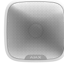
SIRENA INALAMBRICA EXTERIOR AJAX WH

Codigo: 18012 Marca: GARRISON LK-102P-RM $10.160 +iva