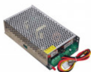
FUENTE CON CARGADOR 13.8VDC 10A

Código: 07081 Marca: AXXTEC AX-FSC-14V5A $28.120 +iva