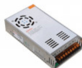
FUENTE SWITCHING 12VDC 30A

Código: 07082 Marca: AXXTEC AX-FSC-14V10A $34.610 +iva