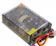
FUENTE CON CARGADOR 13.8VDC 5A

Código: 07081 Marca: AXXTEC AX-FSC-14V5A $28.120 +iva