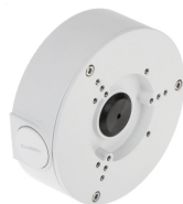
CAJA SOPORTE CONEXION DAHUA REDONDA 12.4X4.1CM IP66

Codigo: 10241 Marca: DAHUA PFA130-E $11.690 +iva