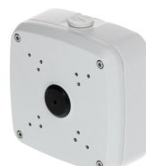
CAJA SOPORTE CONEXION DAHUA BALA EXT 13.4X13.4X5CM

Codigo: 10246 Marca: DAHUA PFA152-E $10.430 +iva