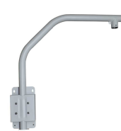
SOPORTE PTZ DAHUA CON BRAZO EXTENDIDO 87X83X18CM

Codigo: 10237 Marca: DAHUA PFA121-V2 $14.790 +iva