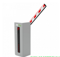
BARRERA VEHICULAR 4.5M. 2.5SEG C-LED CABINA DERECHA

Codigo: 42308 Marca: ZKTECO BL-852Q38A-LP $762.090 +iva