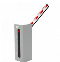
BARRERA VEHICULAR 4.5M. 2.5SEG C-LED CABINA IZQUIERDA

Codigo: 42239 Marca: ZKTECO PROBG3045L-LED $1.323.940 +iva